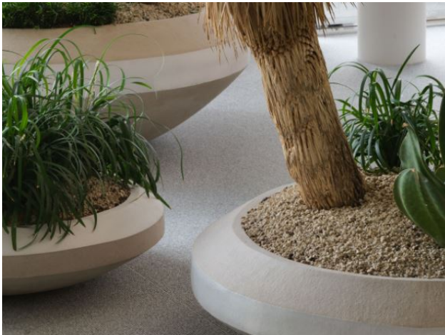
Abbildung 3: Einzelne Gefässe (Eilo, 2023)