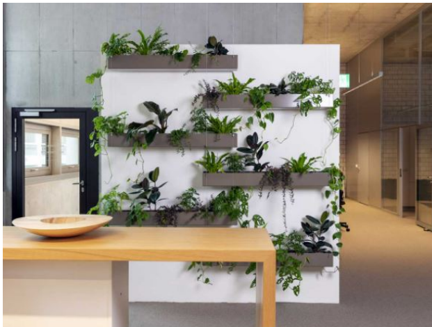
Abbildung 1: Hängende Gefässe (Hydroplant AG, 2023)

Produkt: Hängende Pflanzgefässe an Drahtseilen an die Decke montiert Erscheinung: Optisch ansprechend, leichte Erscheinung Funktion: Pflegeleicht, perfekt als optische lockere Begrünung Bewirtschaftung: Händische Bewässerung durch Gärtner