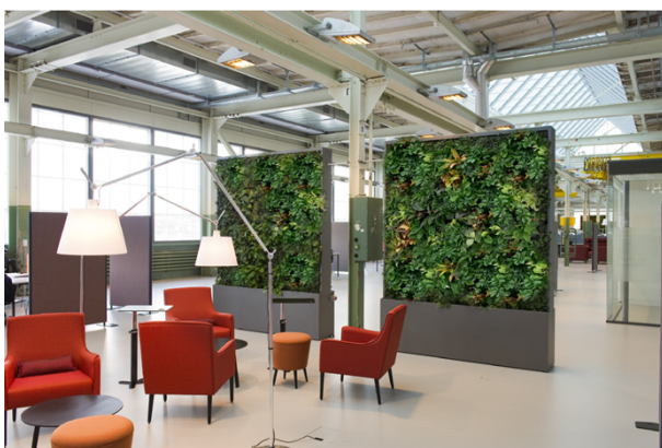
Abbildung 7: Begrünter Raumtrenner 1 (Hydroplant AG, 2023)