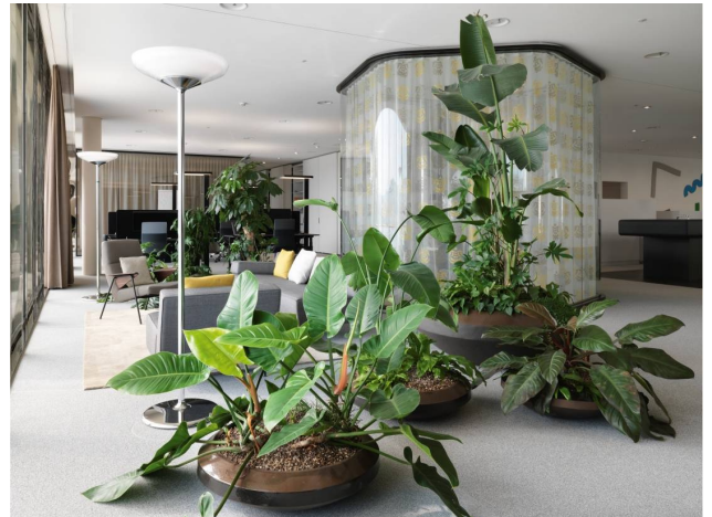
Abbildung 6: Pflanzenkombination 2 (Eilo, 2023)