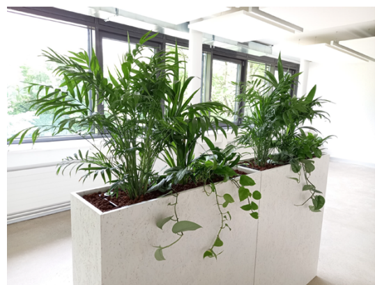
Abbildung 8: Begrünter Raumtrenner 2 (Hydroplant AG, 2023)