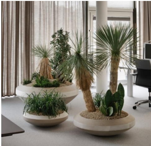
Abbildung 5: Pflanzenkombination 1 (Eilo, 2023)