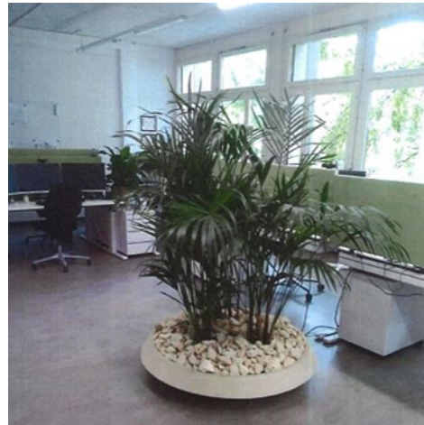
Abbildung 4: Einzelnes Gefäss im Büro (Eilo, 2023)