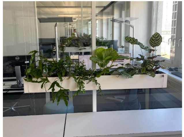
Abbildung 2: Hängende Gefässe vor Glaswand (Hydroplant AG, 2023)